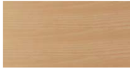
Gedempt Beuken (BD) + (QD)