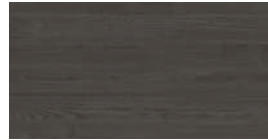
Piment Essen (PE) + (MP)