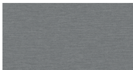
Geslepen Aluminium (AG) + (QU)