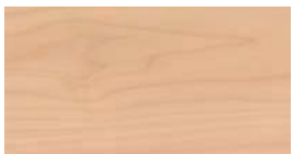
Ahorn (RA) + (FA)