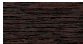
Wengé (RW) + (FW)

Bij gefineerde werkbladen kunnen natuurlijke en door de tijd ontstane optische veranderingen van het oppervlak optreden. Deze afwijkingen zijn natuurlijk en zijn geen reden voor een reclamatie. Aanbeveling van de fabrikant: decor van de corpus in Antraciet of Geslepen Aluminium. Let op! Het structuurverloop van de fineer bladen is niet automatisch identiek aan het standaard structuurverloop van de melamine bladen. Dit is de reden waarom men bij opdrachten met fineer ALTIJD een tekening met het gewenste structuurverloop MOET bijvoegen.