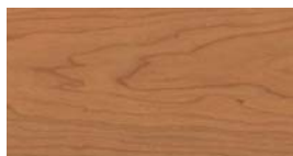
Amerikaanse Kersen (RK) + (FK)