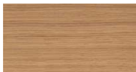
Eiken Natuur (RS) + (FS)