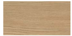
Eiken Natuur (NE) + (QI)