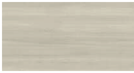
Crema Beuken (CB) + (MR)