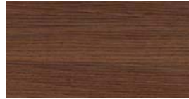
Noten Natuur (NN) + (QL)