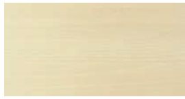
Ahorn (AH) + (QA)