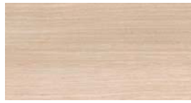
Acacia (AZ) + (QX)