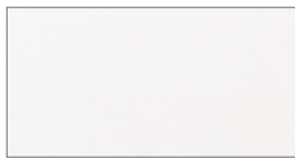
Superwit (WE) + (QW)