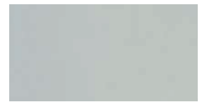
Grijs Parel (GR) + (QG)