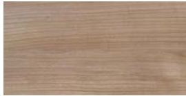
Toskaans Noten (NB) + (QN)