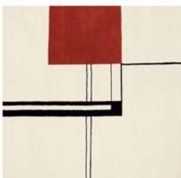
WENDINGEN 1925 - 1935