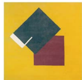
CASTELLAR 1925 - 1935