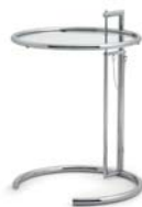
ADJUSTABLE TABLE E 1027 1927