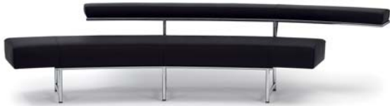
Leder schwarz leather black

Estructura de tubos de acero cromado. Marco de madera de haya acolchado con bandas de goma, poliuretano con espuma. Tapicería de tela o cuero. Detalles y colores ver lista de precios.