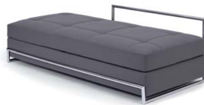
DAY BED 1925